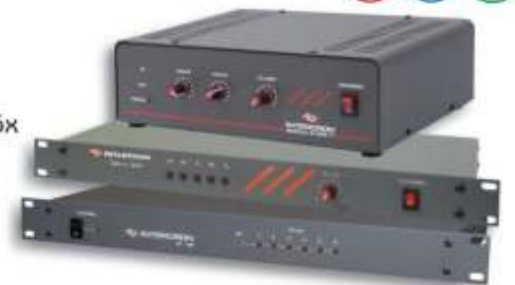
GT - 301 / 5x GT - 306

(P) PROTECCION (FAN) VENT. FORZADA (100V) SALIDA 100V (ROUTER) RUTEADOR DE SEÑAL