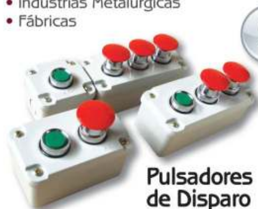
Pulsadores de Disparo